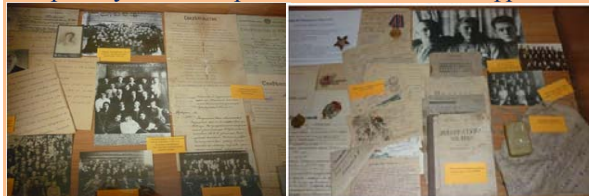
Летописи образовательных учреждений